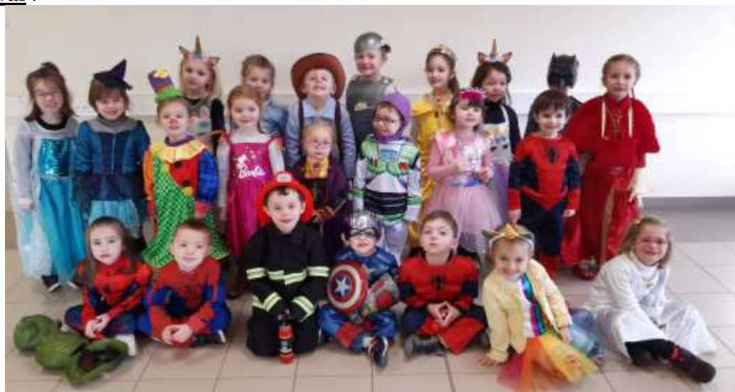
Les écoliers se sont déguisés pour le carnaval