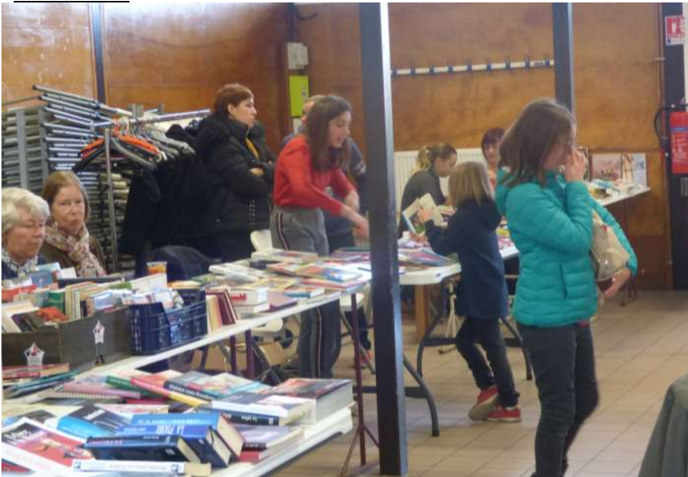
La bourse aux livres s'est déroulée le dimanche 10 novembre 2019 au Mille Club.