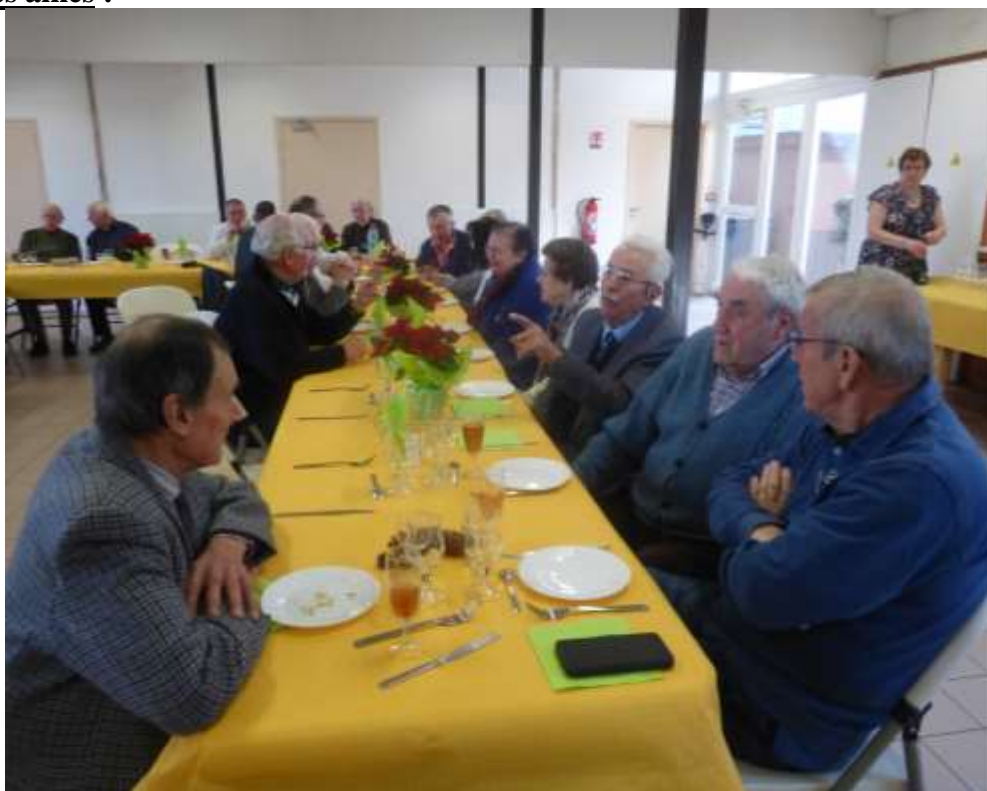
Le repas des aînés s'est déroulé le dimanche 17 novembre 2019 au Mille Club.