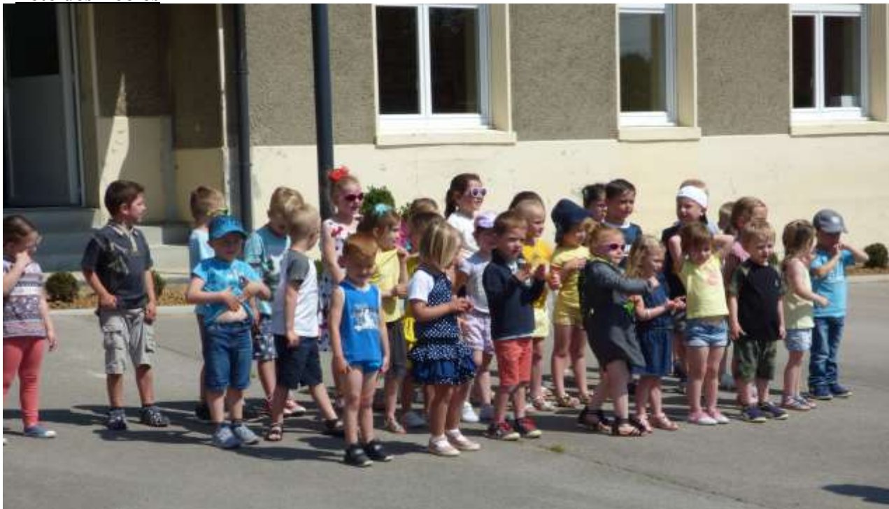
La Fête des écoles du RPI Ablainzeville – Courcelles le Comte – Gomiécourt s'est déroulée le samedi 22 juin à l'école de Courcelles le Comte.