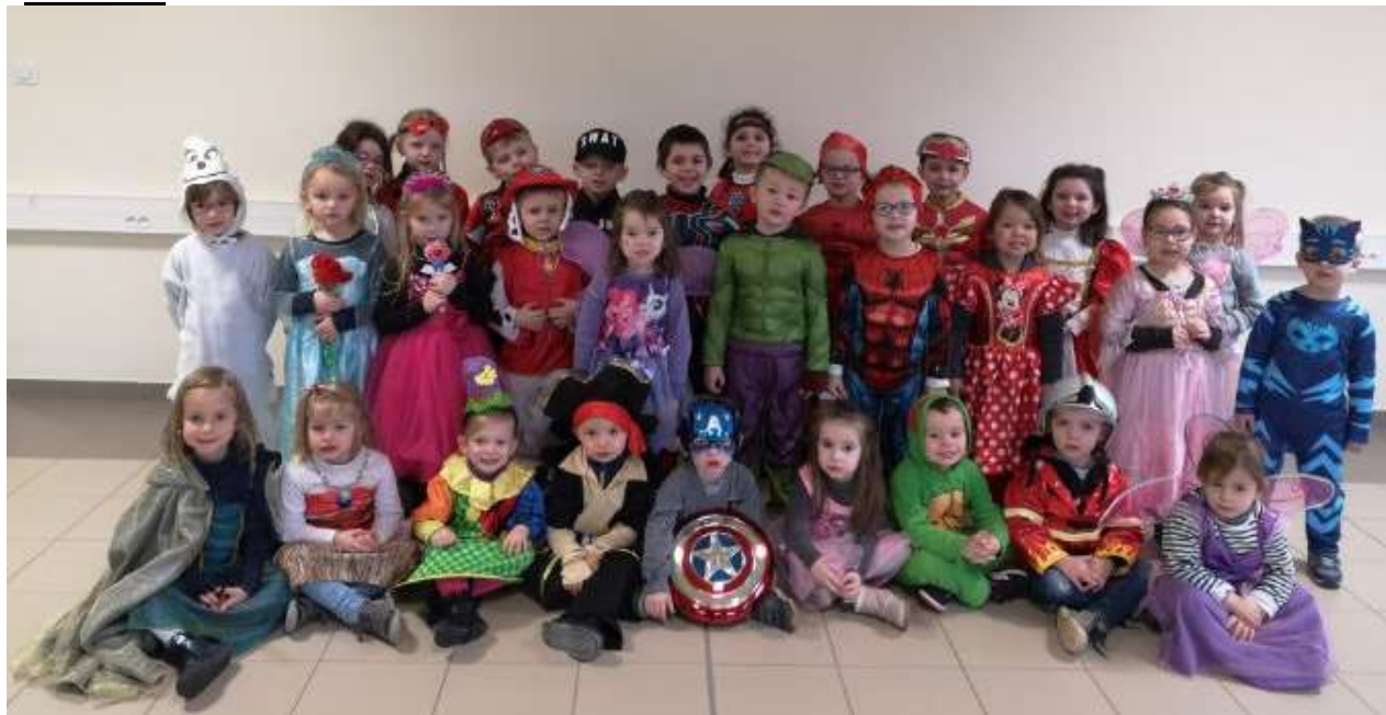
A l'école, les enfants se sont déguisés pour le carnaval.