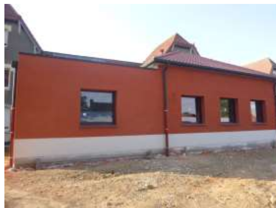
Le nouveau bâtiment est quasiment achevé.