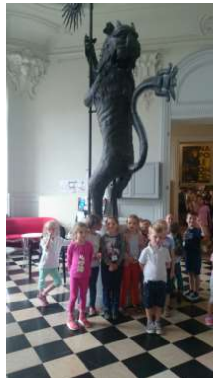
Les enfants de la classe de Madame Delporte se sont rendus au musée et au théâtre d'Arras.