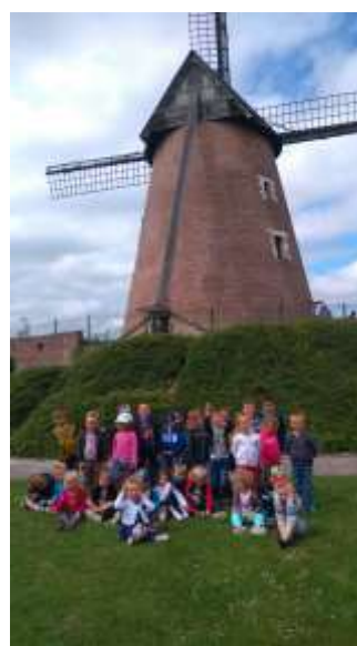
Sortie éducative au Moulin d'Achicourt et Cité-Nature à Arras.