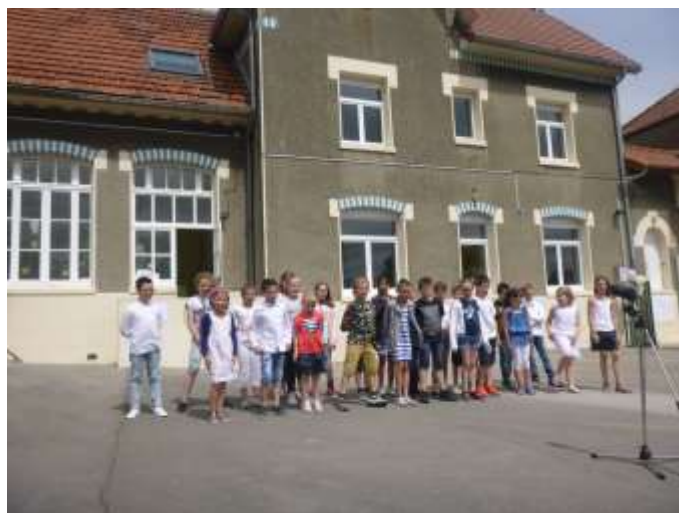
Les élèves de l'école de Gomiécourt