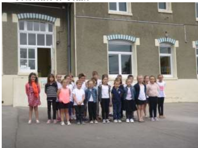
Les élèves de l'école d'Ablainzevelle

La Fête des écoles s'est déroulée le samedi 24 juin à l'école de