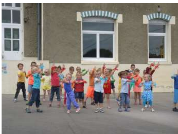
Les élèves de l'école de Courcelles-le-Comte