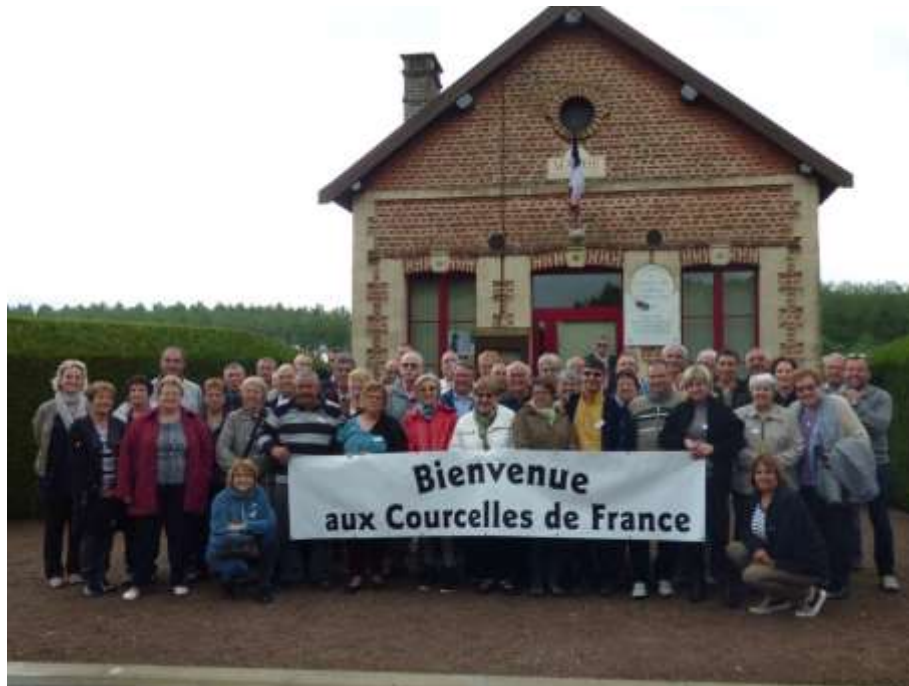
Amitié et solidarité entre les Courcelles de France

* Courcelles de France : L'assemblée générale des Courcelles de France s'est tenue à Courcelles-sur-Voire, commune de 23 habitants située dans l'Aube. Notre commune était représentée par une petite délégation.