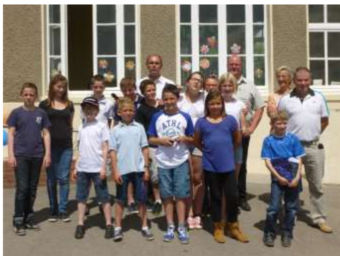
La remise des prix au élèves de CM2

* Fête des Ecoles : La Fête des écoles s'est déroulée le samedi 27 juin à Courcelles.