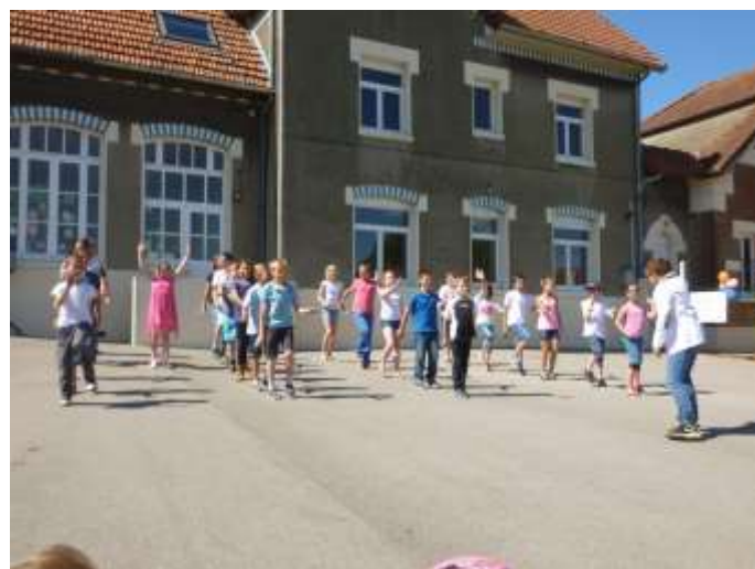
Les enfants ont assuré le spectacle.

* Les menus de la cantine : Lys Restauration rue du Riez d'Elbecq ZI Roubaix Est 59390 LYS-LEZ-LANNOY (03.20.66.12.12) www.api-restauration.com .